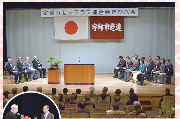
4月25日(木)、代議員200名が出席し、宇部市多世代ふれあいセンターホールで定期総会を開催しました。