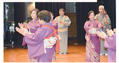
船木校区の皆さん

船木小唄を全国版にするために地域に広める目的で頑張り、それが演じる部門で全国大会の山口県代表で出演させていだいたのは一生の記念になりました。