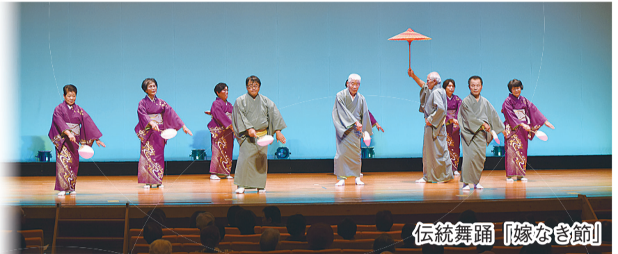
伝統舞踊「嫁なき節」

これまでに取り組んできた「伝統・復活」健康民謡教室が、船木コミュニティ推進協議会の協力を得て、地域の中に浸透してきたことをチャンスに、期間を決め集中的な会員増強に取り組んだ成果です。自分の夫を入会させた会員もいましたが、まだ道半ばということです。さらに目標に向かって進んでいるところです。